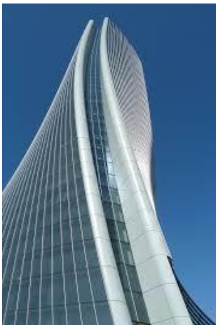
2018 Tour à Milan

Les nouveaux concepts développent des formes qui s'adaptent aux programmes. L'architecture sort des sentiers battus pour s'adapter au Monde Moderne. L'architecte devient le fer de lance d'une innovation ou l'image devient révélatrice d'une société en mutation. Aujourd'hui nous avons ceci, demain qu'aurons nous ?