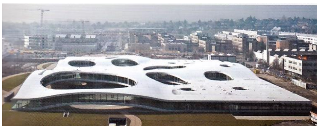
2004 Ecole polytechnique à Lausanne