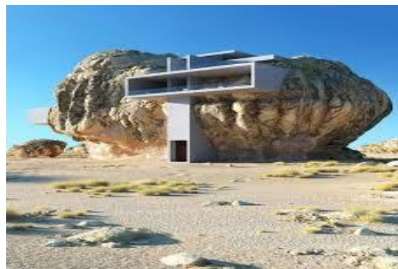
2018 dans le désert d'Arabie