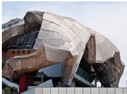
2016 Pavillon à Milan