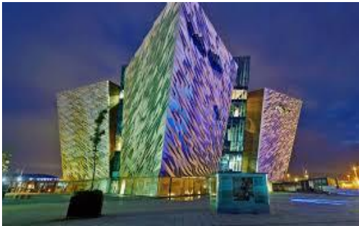
1961 Musée Titanic à Belfast

Les nouveaux concepts développent des formes qui s'adaptent aux programmes. L'architecture sort des sentiers battus pour s'adapter au Monde Moderne. L'architecte devient le fer de lance d'une innovation ou l'image devient révélatrice d'une société en mutation. Aujourd'hui nous avons ceci, demain qu'aurons nous ?