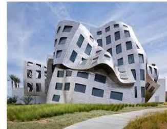
Logements aux Etats Unis