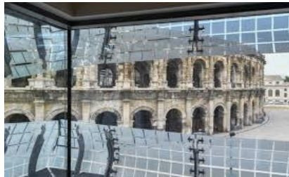
2016 Musée de la Romanité à Nîmes