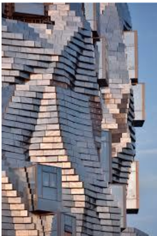
2016 Logements aux Etats Unis