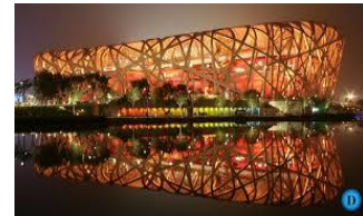
2008 Stade National de Pékin