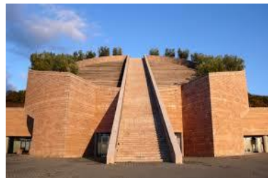
2003 La cave "Petra" à Suvereto (Italie)