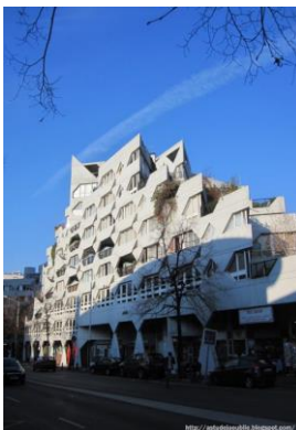
1970 Logements à Ivry