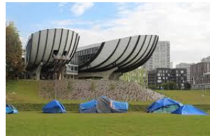
1966 Auditorium Reims