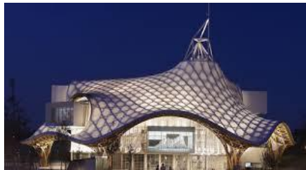
2003 Musée Pompidou à Metz