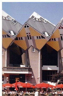
1978 Logements à Rotterdam

Une année pour attendre et oublier les méfaits de la Covid,