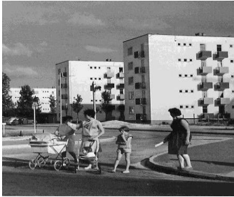
1953 Poissy ou ailleurs

Du béton en 1775, au BAUHAUS, à Le Corbusier .... à l'architecture contemporaine page 1