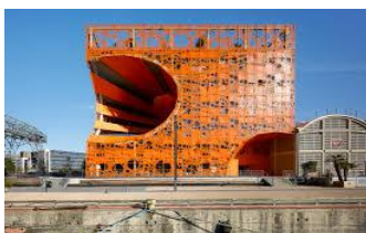
2007 Salins des Docks à Lyon