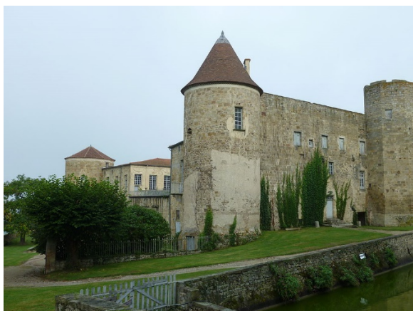
Château de Ravel