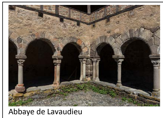
Abbaye de Lavaudieu