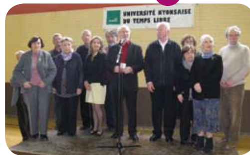
Le Conseil d'administration de l'UNTL

Ce sont ainsi, dans un cadre associatif et amical, plus de 300 heures d'enseignement dans seize spécialités tout au long