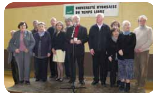
Le Conseil d'administration de l'UNTL